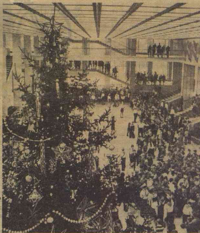
НА СНИМКЕ: праздники на Главной ёлке страны, в Кремлёвском Дворце съездов.